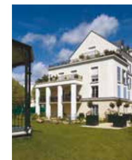
La Closerie Trianon - Le Plessis-Robinson (92)