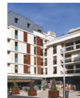
Carré de Flore - Bourg-la-Reine (92)

VINCI Immobilier, filiale du Groupe VINCI, est aujourd'hui un acteur majeur de la promotion immobilière en France. Grâce à sa grande expertise, VINCI Immobilier s'est imposé comme une référence sur le marché immobilier résidentiel de qualité. Services et accompagnement garantissent à ses clients un investissement en toute confiance.