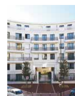
63 Chaptal - Levallois-Perret (92)

Depuis plus de 25 ans, Pitch Promotion crée et réalise des opérations immobilières, pour des programmes haut de gamme, la réhabilitation-rénovation et des opérations de proximité. Notre savoir-faire se traduit à travers la sélection des meilleurs sites, en y apportant une qualité architecturale respectueuse de l'environnement et de l'identité du lieu, toujours en concertation avec les élus et les habitants, pour que votre satisfaction soit totale.