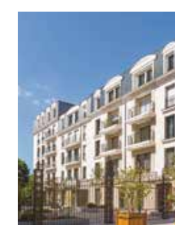
Cœur Nature - Rueil Malmaison (92)