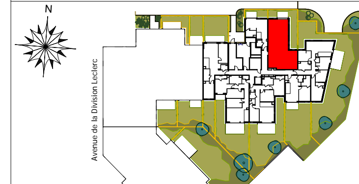
ILOT 1 - 2